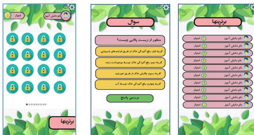
شکل ۱. گیمیفیکیشن (بازی‌وارسازی) محیط‌زیست