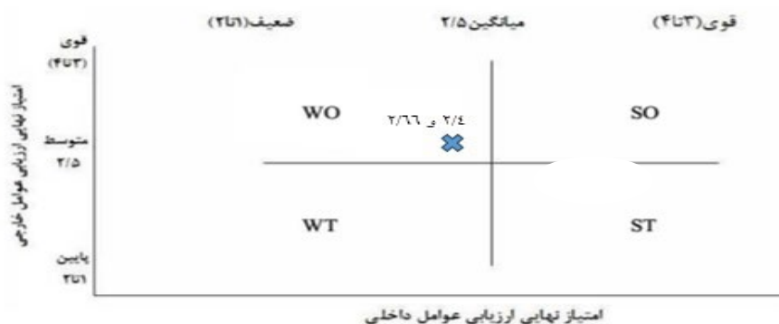
شکل ۳. ماتریس داخلی- خارجی (فضای راهبردی) مراکز تالابی کشور

پس از تدوین ماتریس‌های ارزیابی عوامل داخلی و عوامل خارجی، در این مرحله به‌منظور تعیین فضای راهبردی مراکز تالابی اقدام به تشکیل ماتریس داخلی- خارجی شد که در شکل (۳) نمایش داده شده است. در این شکل، نقطه تلاقی جمع امتیازهای عوامل خارجی و داخلی مراکز تالابی بر روی محور Xها و Yها تعیین‌کننده موقعیت/فضای این پروژه در ماتریس داخلی و خارجی است. از آنجایی که جمع امتیاز نهایی