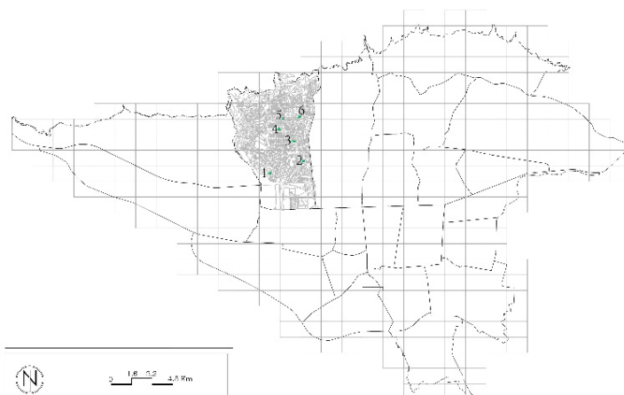
شکل ۱. موقعیت پارک‌ها در منطقه ۵ تهران

از نظر محیطی، منطقه دارای ۲۱۳ پارک شهری و محلی با مجموع مساحت بیش از ۳۰۵ هکتار فضای سبز عمومی است و