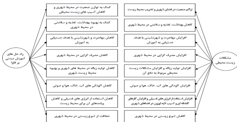
شکل ۳. راه حل‌های آموزشی مبتنی بر فاوا در کاهش مشکلات زیست محیطی

رویه جمعیت و کاهش و نابودی منابع طبیعی در مناطق شهری و به تبع آن بروز پی در پی بحران‌های زیست محیطی، به کارگیری آموزش مبتنی بر فاوا با ویژگی‌هایی که دارد را می‌طلبد که می‌تواند تا حدی راه‌گشای کاهش برخی از مشکلات، در این زمینه باشد. لذا اگرچه توسعه آموزش مبتنی بر فاوا با اهداف دیگری شکل گرفته است و اهداف خاصی را نیز دنبال می‌کند، اما می‌توان از آن در ایجاد موازنه زیستی و رفع معضلات محیطی بهره گرفت زیرا این نظام آموزشی با ویژگی‌های منحصر به فرد انعطاف زمانی و مکانی، سبب حذف بعد مسافت و در نتیجه کاهش مهاجرت از شهرها به روستاها با هدف دستیابی به نظام آموزش و پرورش می‌شود و افزایش‌های با کیفیتی را در هر مکان ارائه می‌دهد. همچنین افزایش مهارت و دانش روستائیان از طریق این نظام آموزشی، خود