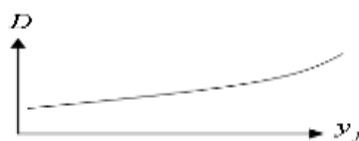
نمودار ۳. تحلیل حساسیت تقاضای گردشگری نسبت به درآمد خارجی

افزایش درآمد خارجی منجر به افزایش تعداد گردشگران می گردد. مثلاً اگر درآمد خارجی از ۴ هزار دلار به ۵ هزار دلار افزایش یابد تعداد گردشگران از ۲/۷۹ میلیون نفر به ۴/۱۶ میلیون نفر افزایش می یابد. باین حال تحقق این امر به طور خاص تابع کشش درآمدی و قیمتی تقاضای گردشگری خواهد بود.