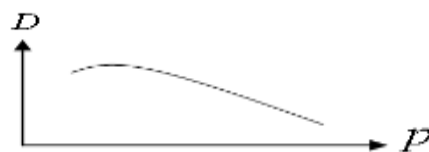
نمودار ۴. تحلیل حساسیت تقاضای گردشگری نسبت به سطح قیمت ها

اگر سطح قیمت ها از مقدار پایه یعنی ۱/۹۱۱ به ۲/۹۱۱ برسد تعداد گردشگران از ۲/۷۹ به ۱/۴۲ کاهش می یابد.